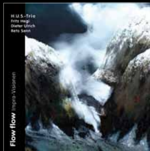
// FRITZ HEGI TRIO // FLOW FLOW IMPRO-VISIONEN // UTR 4450

05.09.13 ESSE BAR, WINTERTHUR CH 13.09.13 KINO RÄTIA, THUSIS CH 18.09.13 MOODS, ZÜRICH CH