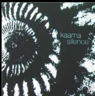
// KAAMA // SILENCE // UTR 4455

29.08.13 BOT. GARTEN, BERN CH 30.08.13 SCHLOSS ÜBERSTORF, ÜBERSTORF CH 01.09.13 THE BLINKER, CHAM CH 02.09.13 THEATER RIGIBLICK, ZÜRICH CH 08.09.13 LA ROTONDE, BIEL CH