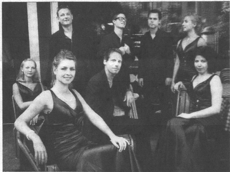
Das Jazzquartett «Five on Fire» und vier Streicherinnen sind in Murten zu Gast.