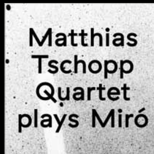
// MATTHIAS TSCHOPP QUARTET // MATTHIAS TSCHOPP QUARTET PLAYS MIRÓ // UTR 4414

16.10.13 LE BOURG, LAUSANNE CH 18.10.13 FESTIVAL JAZZCONTREBAND, CHAT NOIR, GENÈVE CH 23.11.13 AMR, GENÈVE CH 29.11.13 CHORUS, LAUSANNE CH