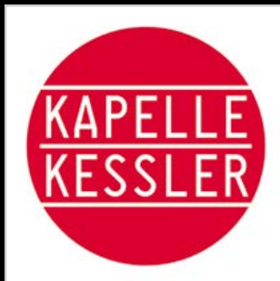
// KAPPELLE KESSLER // KAPPELLE KESSLER // UTR 4470

Der Sound verläuft langsam, manchmal auch überschwappend zu einer dicken, treibenden Suppe. Die Kompositionen von Kessler und Hellmüller mit den Ein- und Ausfällen der Mitmusiker kreuzen sich, pflanzen sich fort, zersetzen sich, um sich wieder zu verschweissen.