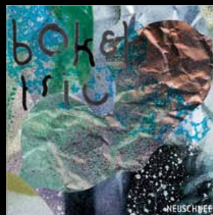
// BOKEL TRIO // NEUSCHNEE // UTR 4419

Ein neuer Stern am CH-Jazz-Himmel. Songs mit Überzeugungskraft, Intensität und Spannung in einer eigenen musikalischen Sprache. Cede.ch 30.08.13 KELLERBÜHNE GRÜNFELS, JONA CH 05.09.13 BIRD'S EYE, BASEL CH