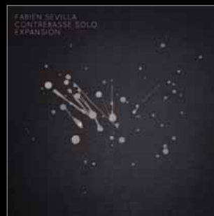
// FABIEN SEVILLA // CONTREBASSE SOLO – EXPANSION // UTR 4465

10.10.13 LITERATURCAFÉ BIEL, CH 11.10.13 DIMENSIONE WINTERTHUR, CH 25.10.13 JAZZSTATION SIERRE, CH 20.11.13 JAZZKANTINE LUZERN, CH